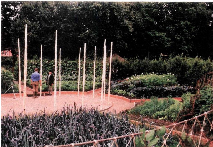
Figur 2 Klassisk oppbygning av demonstrasjonsfelt med samlingsfelt

Demonstrasjonsfeltene gjør det mulig for skoler uten kapasitet eller mulighet til egen dyrkning å få opplæring i dyrkning. Det kan også være aktuelt å opprette demonstrasjonsfelt for demonstrasjon av hvordan andre skolehager kan dyrke sine felt.