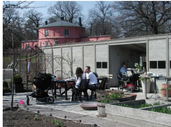
Figur 7 Rosendals tradgård, Stockholm

I fellesområdet er det aktuelt med demonstrasjon av balkongkasse- eller vinduskarmdyrking, dyrking på pallekasser, men også salg av råvarer. Opphøyde dyrkningsfelt gir mer rom for å ta på, gå mellom, inspisere og er mer fleksibelt i en slik sammenheng, det bør også kunne dyrkes vekster som folk kan forsyne seg av (bringebær, rabarbra, kirsebær).