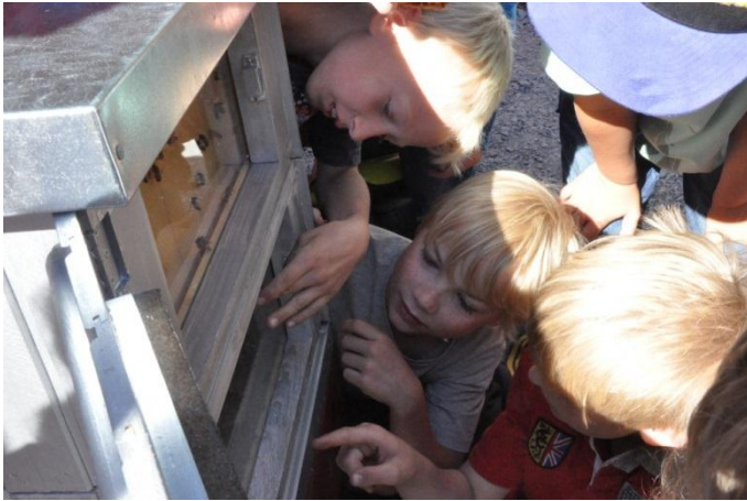
Figur 3 Halden bigård