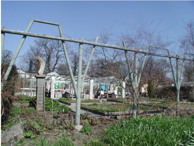
Figur 5 Eksempel på skille mellom «privat» og offentlig

En mulighet kan være å etablere et tydeligere fellesområde enn det som eksisterer i dag, og som tilrettelegges for mer intensiv bruk enn de øvrige områdene. Fellesområdet utformes på en slik måte at det oppleves inviterende og tilgjengelig for alle, ved at det skiller seg tydelig fra de private/ halvprivate dyrkningsområdene. På fellesområdet tilrettelegges det med bord, stoler og grillplasser, og det er åpent for ballspill og lek.