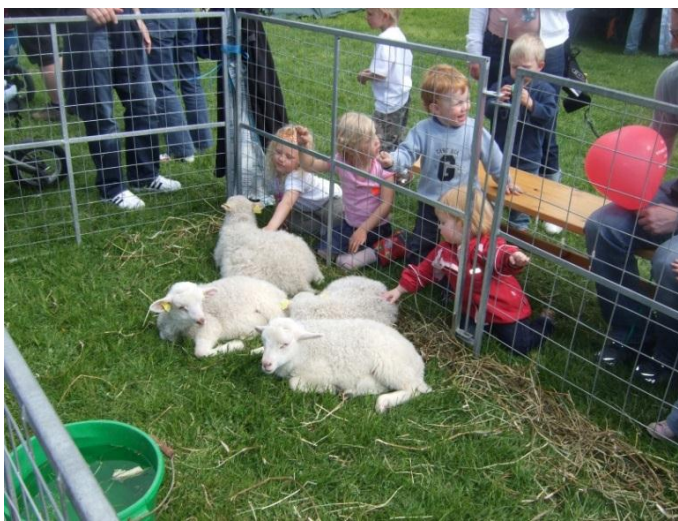
Figur 4 Lam på Bogstad

Som et supplement kan man oppgradere dagens dyrehold til å bli mer relevant for læring. Geitmyra birøkterlag har 5 bikuber som står relativt skjult, men som benyttes i noe grad av Geitmyra matkultursenter i undervisning. Tilbudet er ikke tilrettelagt for læring. Bier har et spennende potensial i undervisningssammenheng og kan enkelt oppgraderes til en læringsarena. Inspirert av Halden bigård kan det etableres en bigård, der barn kan se inn i bikuben, og se når biene kommer med pollen. I tillegg kan demonstrasjon av utstyr, slynging og smaking av honning være aktuelt.