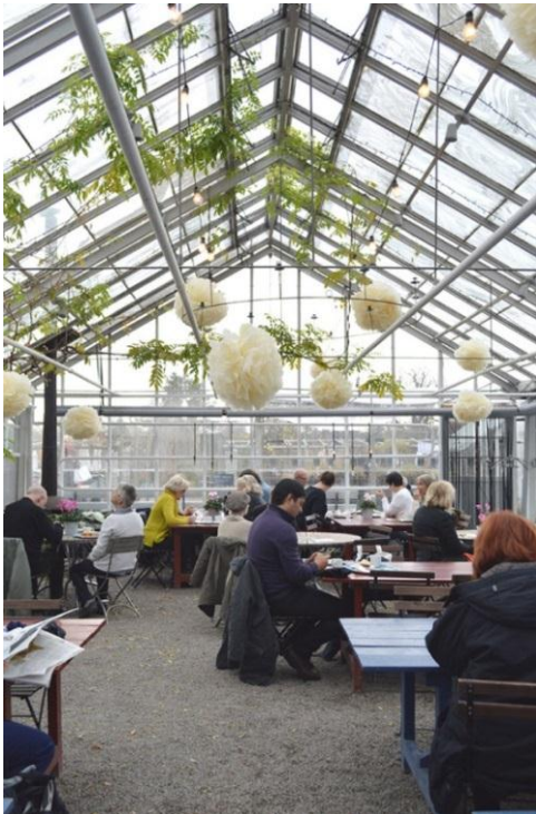
Figur 8 Rosendals tradgård, Stockholm

Dersom det blir økt husdyrhold bør dyrene også berike fellesområdet, og gjøre området attraktivt for småbarnsfamilier i nærmiljøet i helger og på kveldstid. I løpet av workshopen var det flere som ønsket en kafé på området, og det bør vurderes om dette er noe som er aktuelt å legge til rette for. Etter inspirasjon fra Rosendal tredgård, kan drivhus benyttes til uteservering.