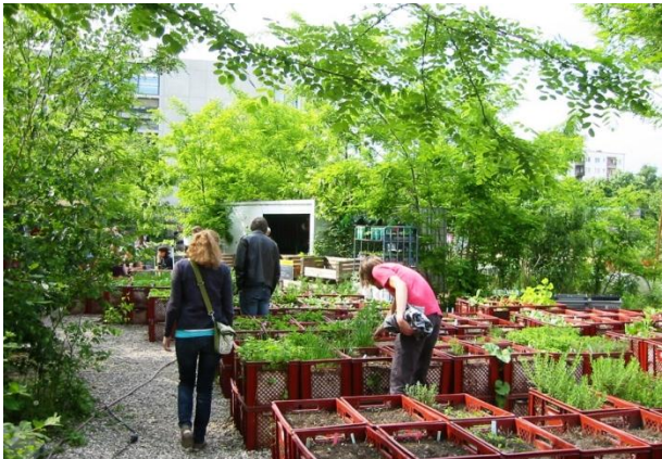
Figur 6 Prinzessinnengarten, Berlin

forbruker ved at det hentes inspirasjon fra besøksgårdskonseptet, og/ eller en møteplass mellom urbane dyrkningsinteresserte for kompetanse og erfaringsutveksling.