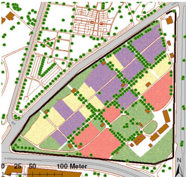
Figur 9 Lilla viser private parsellområder

Å leie et lite jordstykke på Geitmyra er åpent for alle i dag, men ventetiden for å få en privat parsell har de siste årene ligget på 4-5 år. Parselleie er for tiden på kr 400,- der 300,- går til kommunen og 100,- til parsellhagelaget.