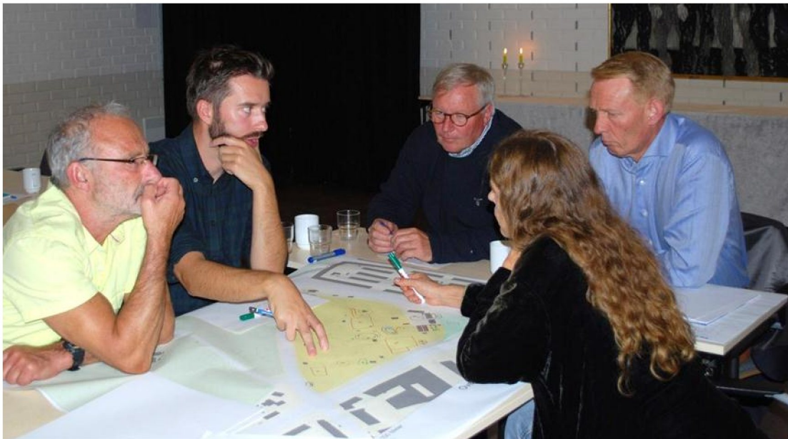
Figur 1 Gruppearbeid

Med overnevnte tematiske avgrensning for mulighetsstudien inviterte Bymiljøetaten interessenter til en workshop med den hensikt å forankre det videre utredningsarbeidet i erfaringene og ønskene til de som bruker og engasjerer seg i området.